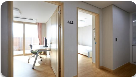
✓ 2인 1실 기준 (침실 분리)