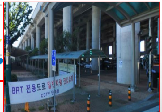
오송역 A,B 주차장 사이 BRT 주차장 내 1번 플랫폼